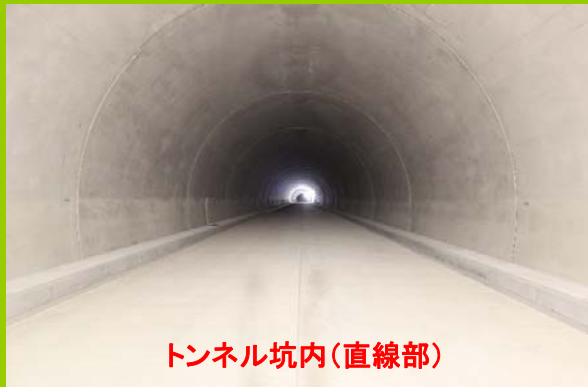
トンネル坑内(直線部)