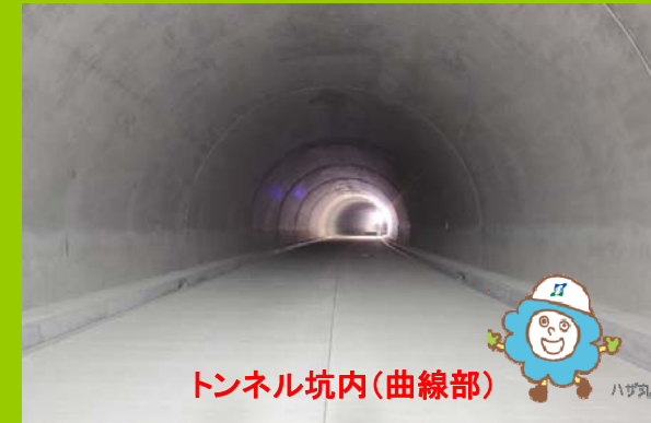
トンネル坑内(曲線部)