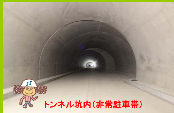
トンネル坑内(非常駐車帯)