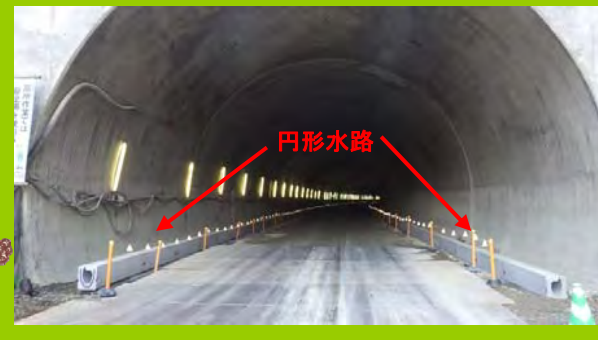
トンネル坑内 起点(岩沼)側 状況

3月中旬頃の、村田側坑口付近の写真です。今ではもう防水シートが貼られていて、覆工コンクリートの施工を待つばかり。