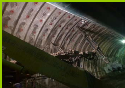
変状に対する補強(増しボルト工)

増しロックボルトを打設して、トンネルの補強を行なっています。赤いスプレーが通常のボルトで青いスプレーが増しボルトです。これで安心!