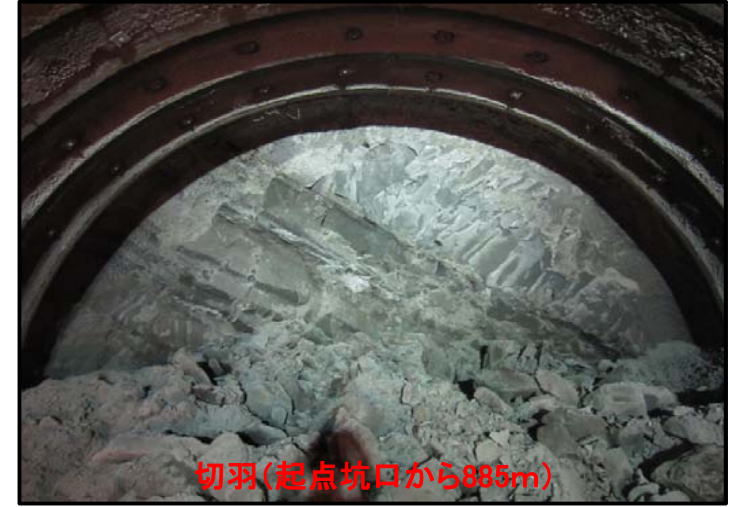
切羽(起点坑口から885m)