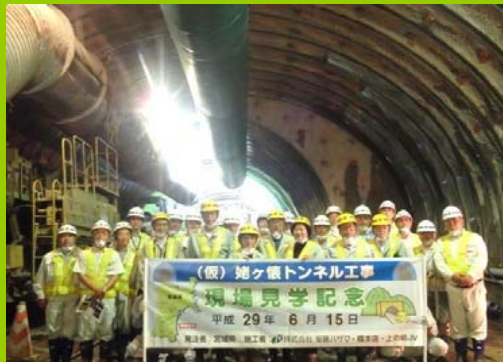
6/15 柴田町議会の皆様