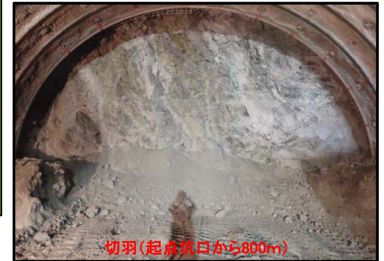
切羽(起点坑口から800m)