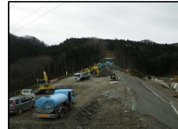
トンネル坑外の現況