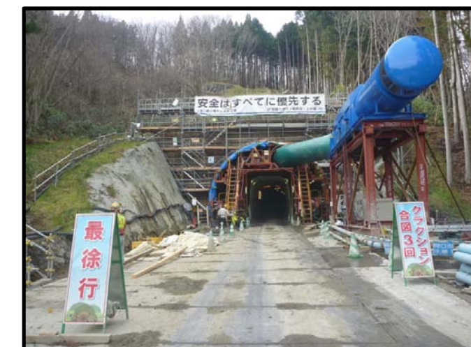
起点側(岩沼側)坑口の現況